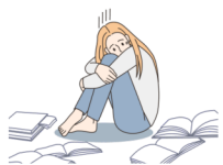
Perturbações na carreira